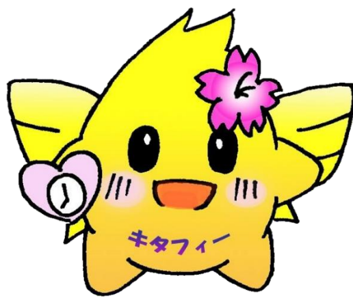
春日北中学校マスコットキャラクター「キタフィー」